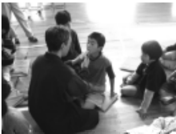
尺八の吹き口で音の出し方を教わった。

・日本の伝統楽器の独特な雰囲気を感じることによって、その時代のイメージをより深く描けるのではないかと考え、琴、尺八、三味線の先生方を招き、演奏をしていただいたり、簡単な体験をさせていただいたりした。