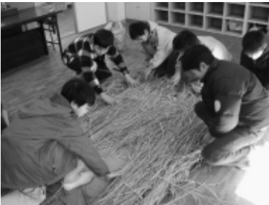
大道具：住居づくり。