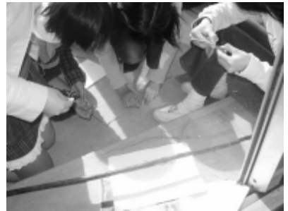
小道具：カラムシから 繊維を取る。