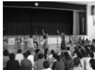
最後に曲に合わせてみんなで踊った。