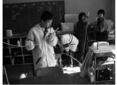
小道具：武器づくり。