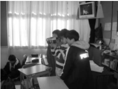
カメラリハーサル