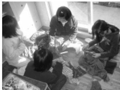
小道具：十二単作成