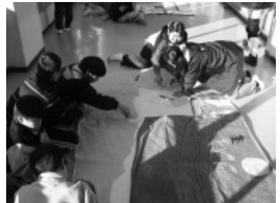
大道具：背景画作成