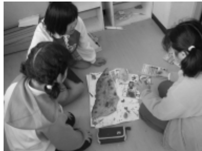
鮭の薫製をつくる