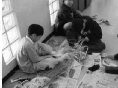
小道具：わらじづくり。